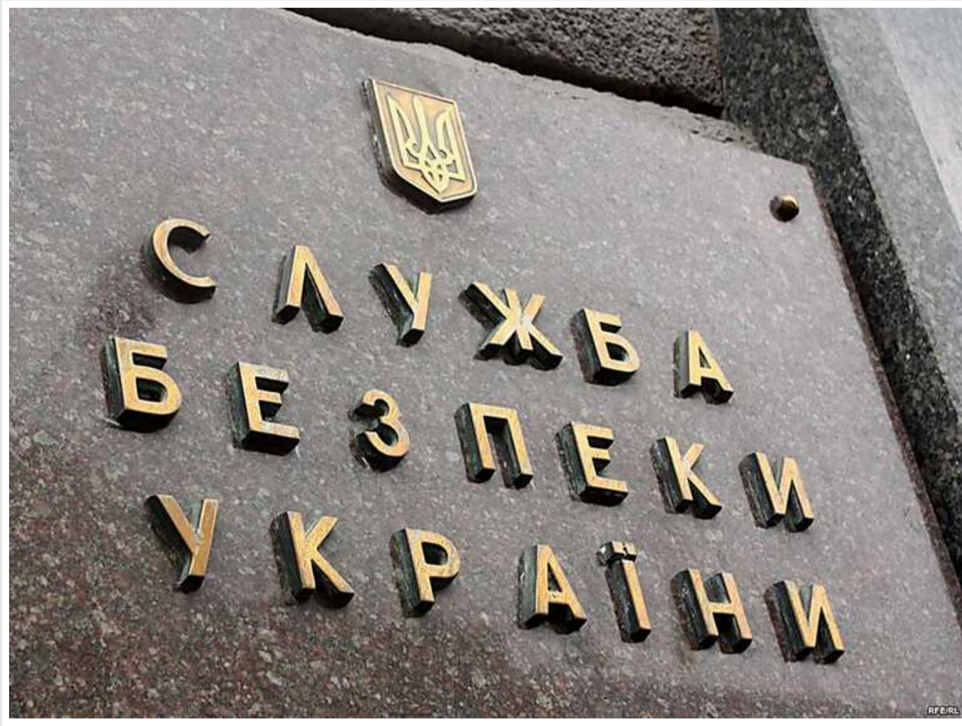
У СБУ прокоментували звільнення голови департаменту: оптимізація – для достатнього рівня безпеки ЗМІ