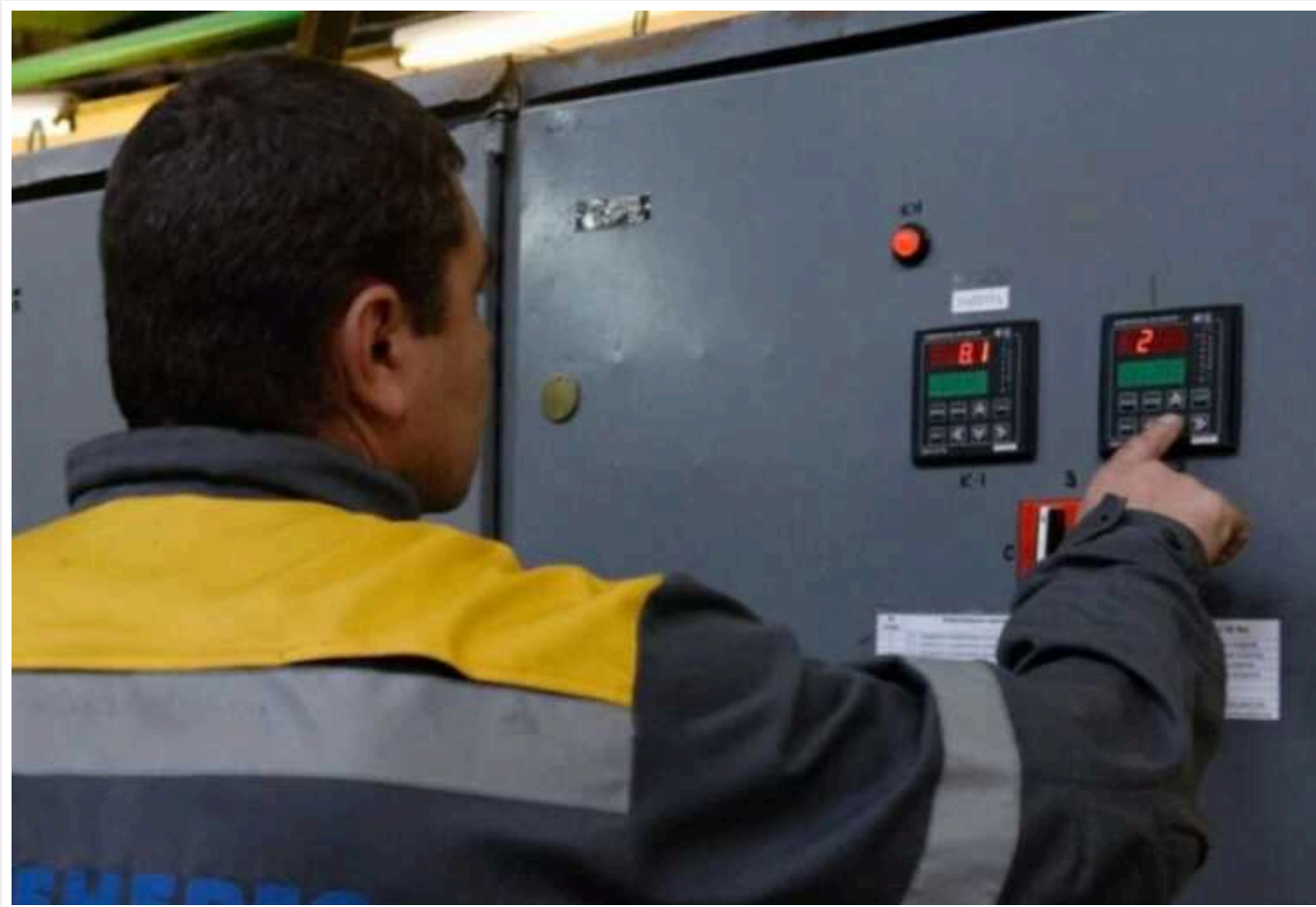
Через яку суму українцям можуть відключити електроенергію

За словами заступника міністра енергетики Світлани Гринчук, постачальники спершу зобов'язані попереджати боржників про існуючі несплати, і що їм можуть відключити світло.