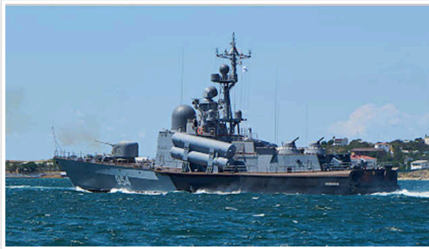
Спецпідрозділ ГУР знищив ракетний катер «Івановець» Чорноморського флоту РФ

Вночі 1 лютого воїни спецпідрозділу "Group 13" Головного управління розвідки Міністерства оборони України знищили ракетний катер "Івановець" Чорноморського флоту РФ.