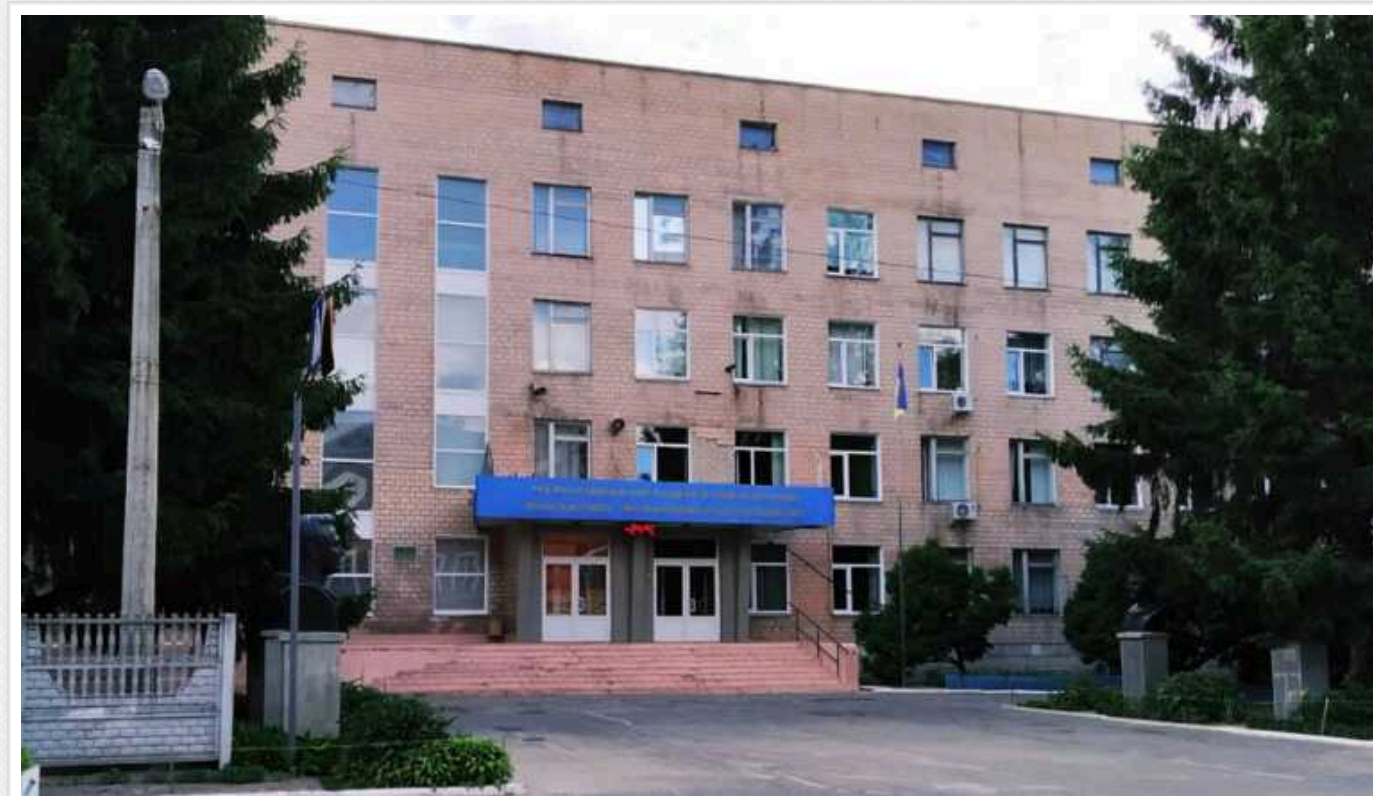
Чернігівська ОДА планує відремонтувати ліцей за 29 мільйонів гривень: прайс завищено у два рази

Управління капітального будівництва Чернігівської ОДА 18 січня за результатами тендеру замовило ТОВ «С-Білдкомпані» капітальний ремонт будівель Чернігівського ліцею за 28,74 млн грн.