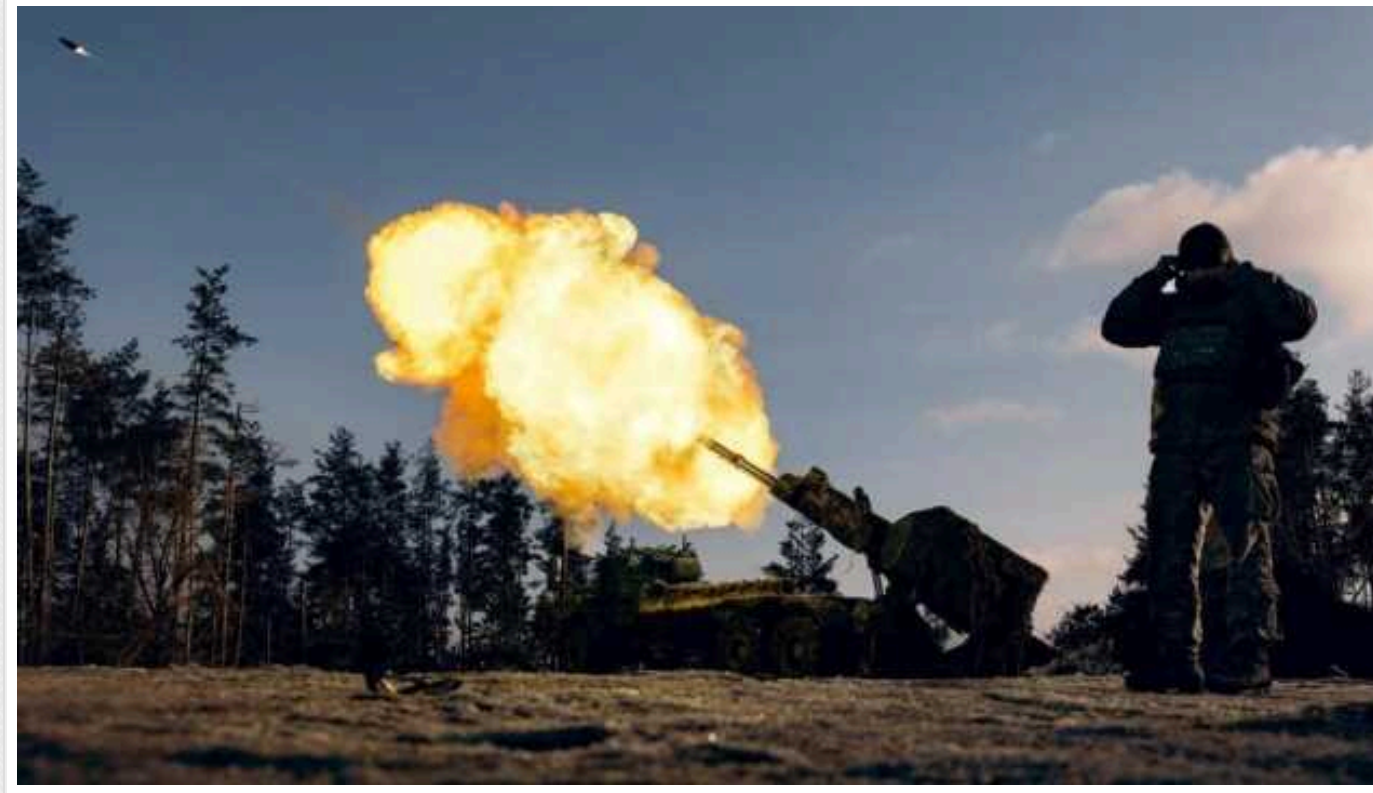
На Таврійському напрямку Сили оборони знищили три склади боєприпасів окупантів

Командувач оперативно-стратегічного угруповання військ «Таврія» генерал Олександр Тарнавський заявив про знищення трьох складів боєприпасів ворога і нейтралізацію або знищення 233 безпілотників різних типів.