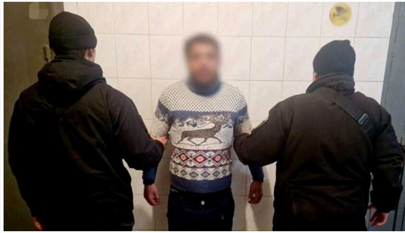
У Києві на гарячому затримали зловмисника: вдарив по обличчю дівчину та пограбував

У Деснянському районі Києва чоловік на вулиці вдарив дівчину по обличчю та пограбував її. Втекти зловмиснику завадили патрульні поліцейські.