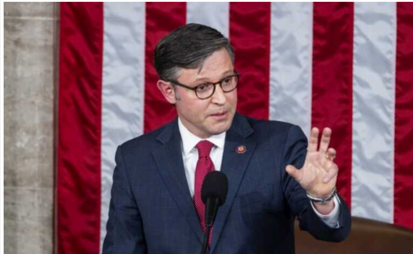
ЗМІ: Спікер Палати представників Джонсон заявив, що питання допомоги Україні та безпеки кордонів "ймовірно" розділять

Спікер Палати представників Майк Джонсон повідомив трьом лідерам парламентів країн Балтії, що питання безпеки кордону з Мексикою та пов'язаної з цим фінансової допомоги Україні "ймовірно" буде розділене через занепокоєння щодо реформування прикордонної політики.