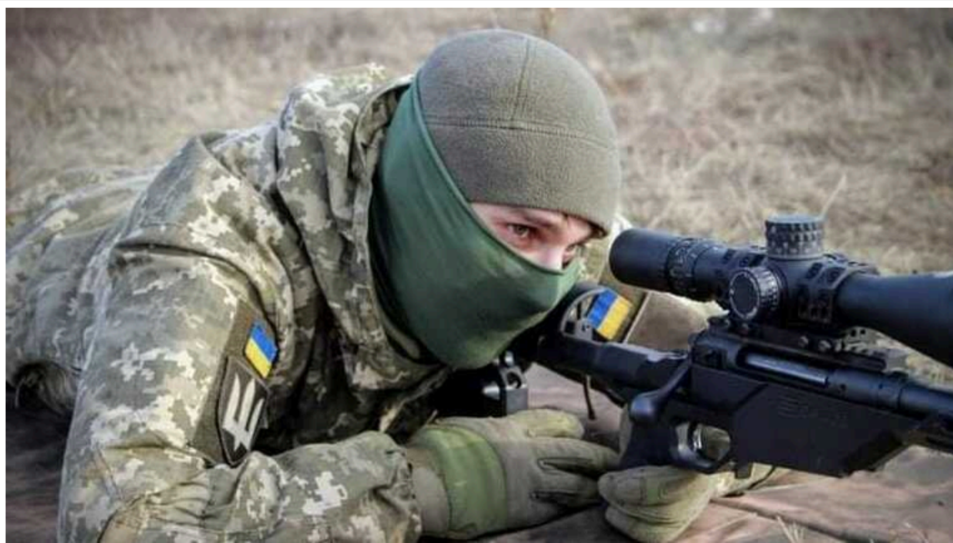
Українські снайпери знищили окупантів з відстані 2680 метрів

Захисники зі снайперської групи "Привиди Бахмута" продемонстрували влучну роботу з дистанції 2680 метрів. У результаті було ліквідовано двох окупантів.