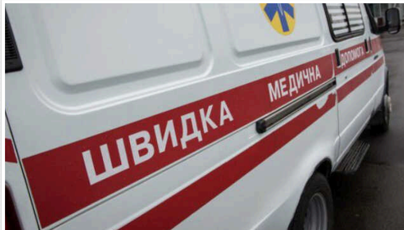
Окупанти за добу на Херсонщині поранили шістьох людей

За минулу добу російська армія здійснила 41 обстріл Херсонської області, шестеро людей зазнали поранень.