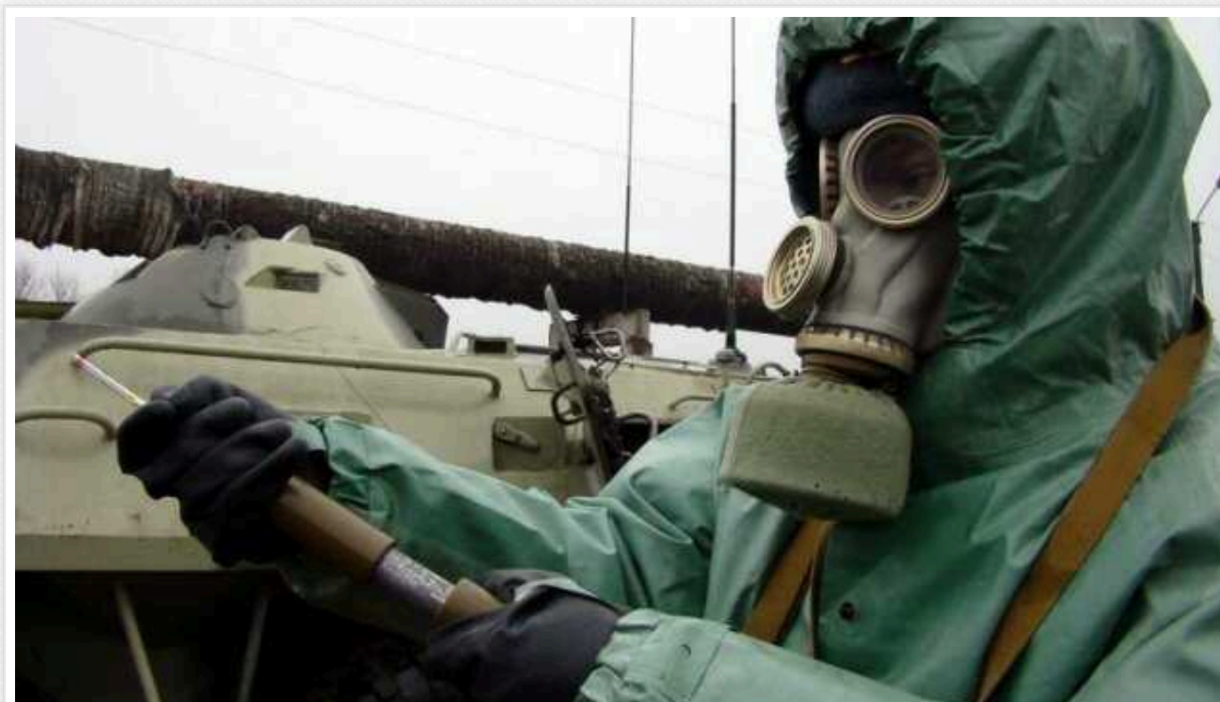
Україна в ОБСЄ: задокументовано 626 хімічних атак з боку РФ