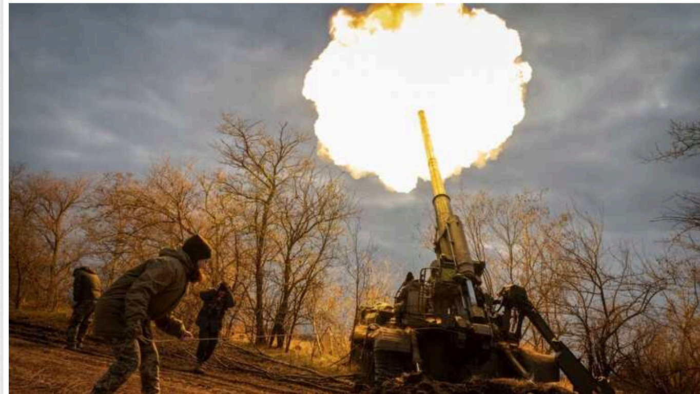
Втрати ворога: за добу ліквідовано 1000 окупантів і знищено 33 артсистеми

Сили оборони України за останній день січня 2024 року знешкодили на фронті 1000 солдатів і найманців російської окупаційної армії. Так, загальні її втрати від початку повномасштабної війни становлять 386 230 осіб.