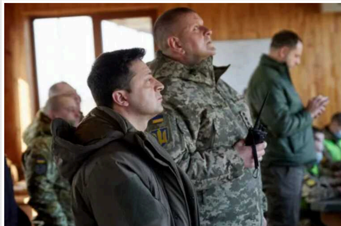
CNN: Зеленський звільнить Головкама ЗСУ Залужного цього тижня

Президент України Володимир Зеленський звільнить Головнокомандувача ЗСУ Валерія Залужного цього тижня, повідомив у четвер, 1 лютого, канал CNN, з посиланням на обізнані джерела.