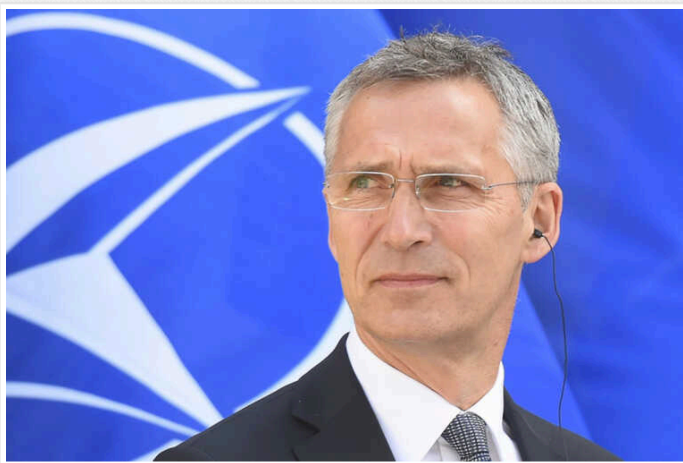
Столтенберга висунули на Нобелівську премію миру

Заступник голови Ліберальної партії Норвегії, депутат Стортингу (парламенту країни) Авід Раджа висуває Генсека НАТО Єнса Столтенберга на Нобелівську премію миру, зокрема, за його працю, спрямовану на припинення російської війни проти України.