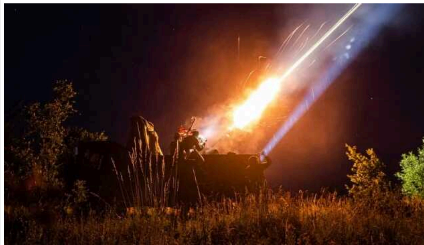
Сили ППО вночі знищили 2 з 4 БПЛА

Силами та засобами протиповітряної оборони України в ніч на 1 лютого було знищено 2 з 4 ворожих дронів-камікадзе.