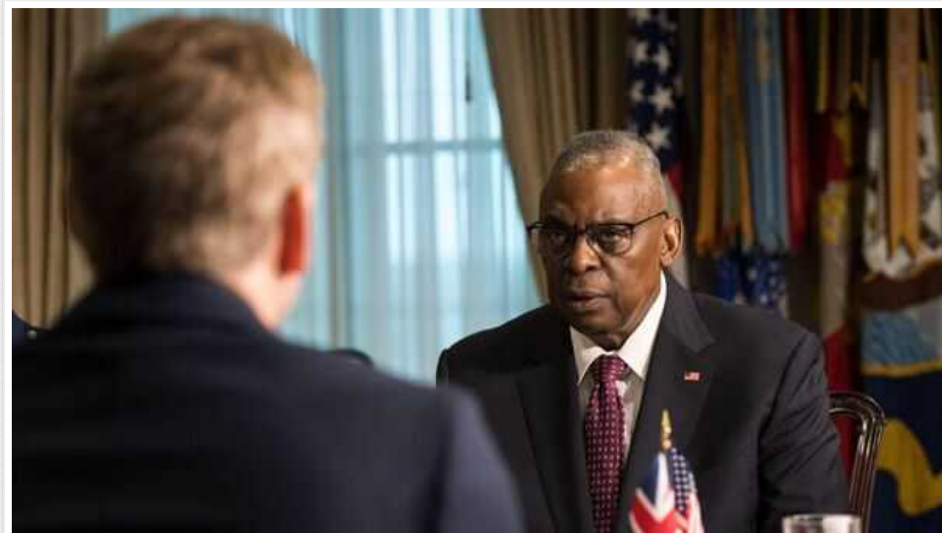
Глава Пентагону Остін та міністр оборони Британії Шаппс обговорили варіанти допомоги Україні

Глава Пентагону Ллойд Остін та міністр оборони Британії Грант Шаппс під час зустрічі обговорили спільну подальшу допомогу Україні.