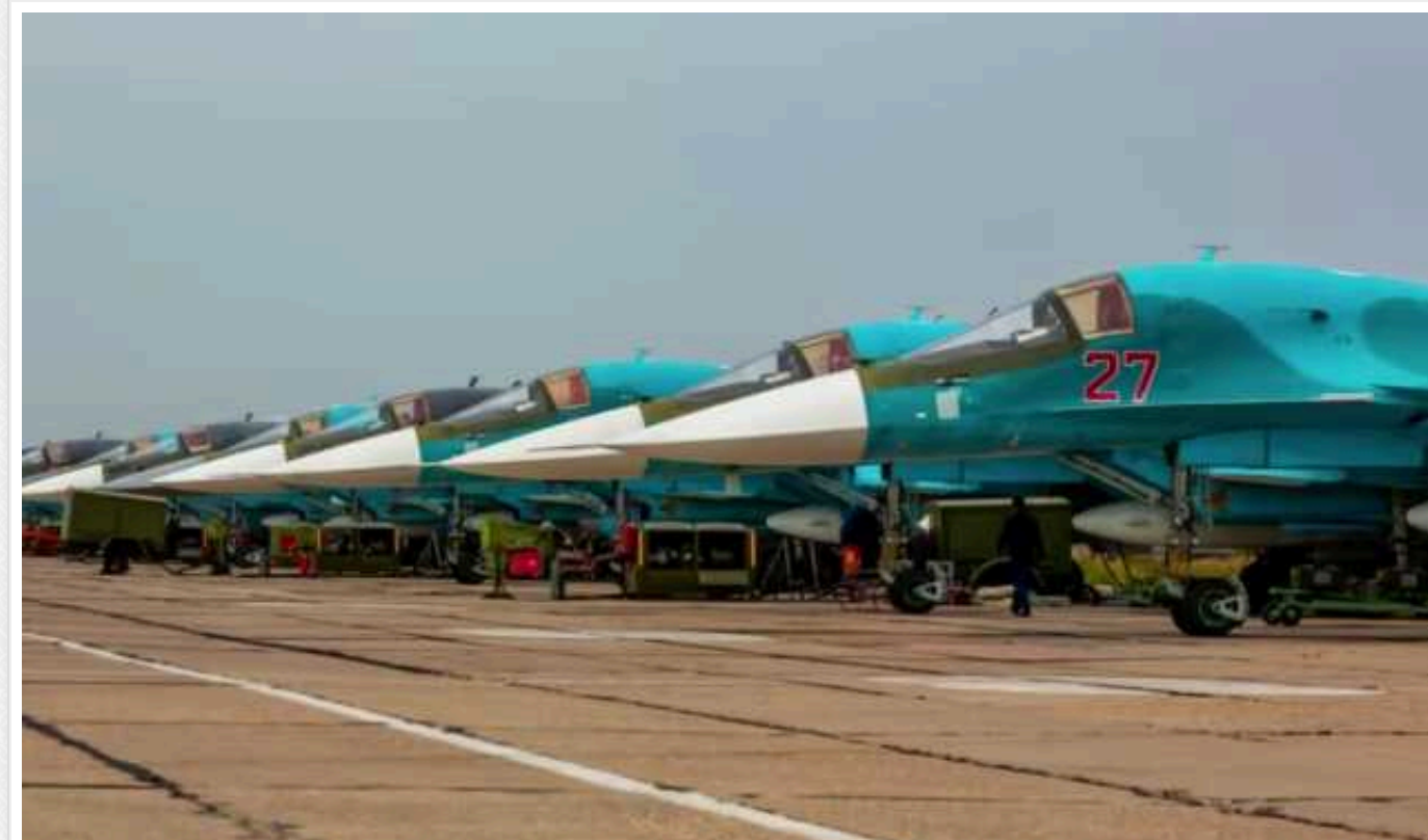
Три молдавські компанії продали РФ авіазапчастин на 15 мільйонів доларів, - ЗМІ

Журналісти з'ясували, що протягом 2022-2023 років три молдавські компанії продали Росії запчастини до літаків на загальну суму близько 15 мільйонів доларів.