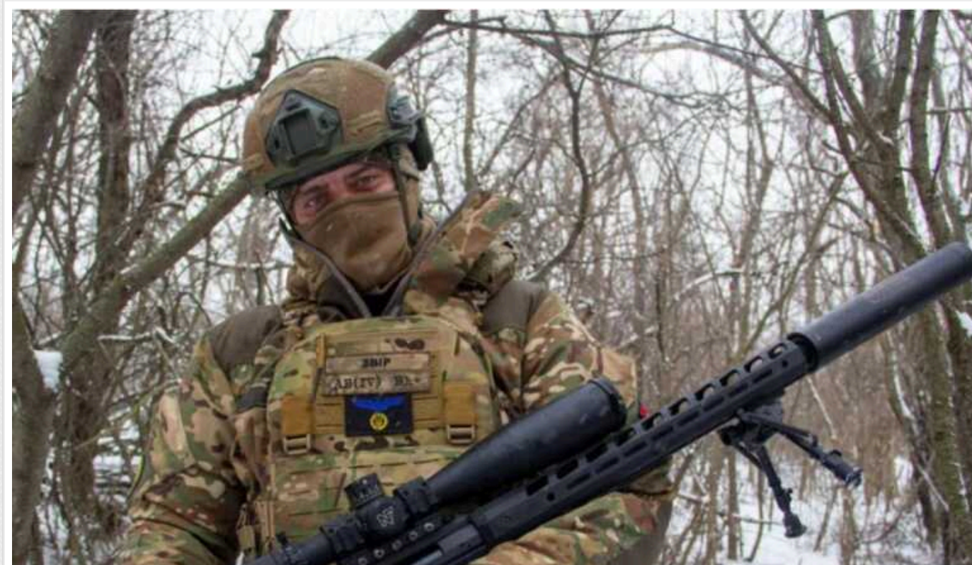
Снайпер ЗСУ ліквідував російського офіцера з майже 4 кілометрів

Військовий застрелив окупанта з великокаліберної снайперської гвинтівки "Володар обрію", яку розробила українська компанія.