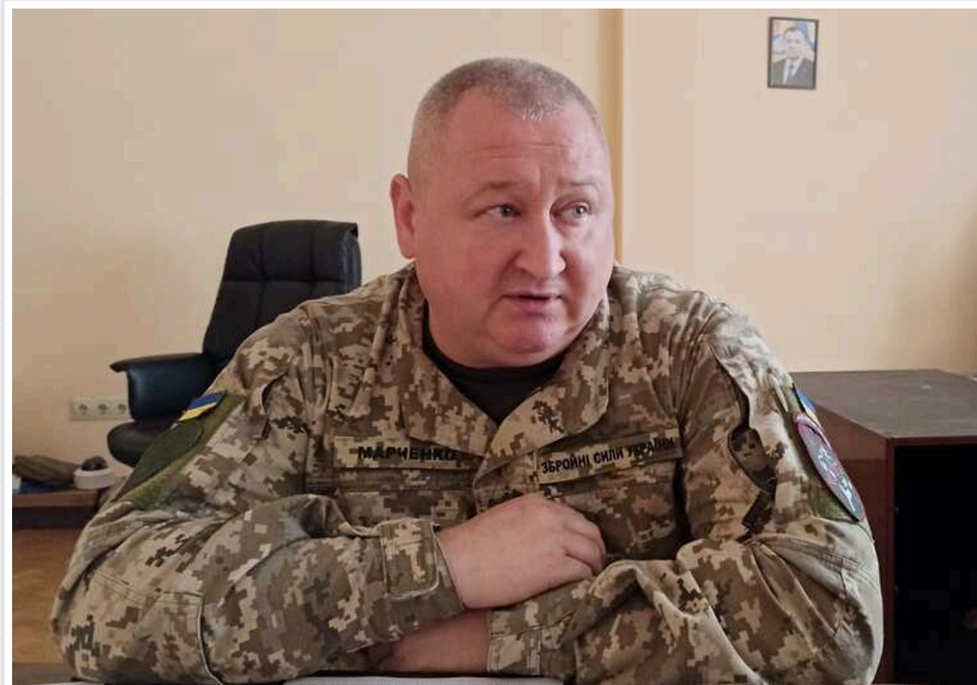
Генерал розповів, чому не варто боятись мобілізації: "Війна торкнеться кожного"

Жодна людина не сховається від війни, тому не варто ухилятися від мобілізації.