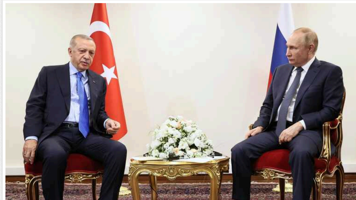
Reuters: Путін вперше від початку війни відвідає країну-члена НАТО

Президент РФ Володимир Путін планує відвідати Туреччину 12 лютого. Там він має зустрітись з турецьким президентом Режепом Тайпом Ердоганом.