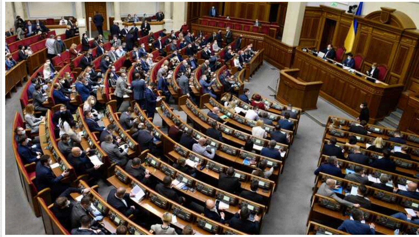
У Верховній раді оцінили новий законопроект щодо мобілізації: потребує доопрацювання

У парламентського Комітету з питань національної безпеки вважають, що оновлена редакція проекту закону щодо мобілізації в Україні ще потребує доопрацювання.