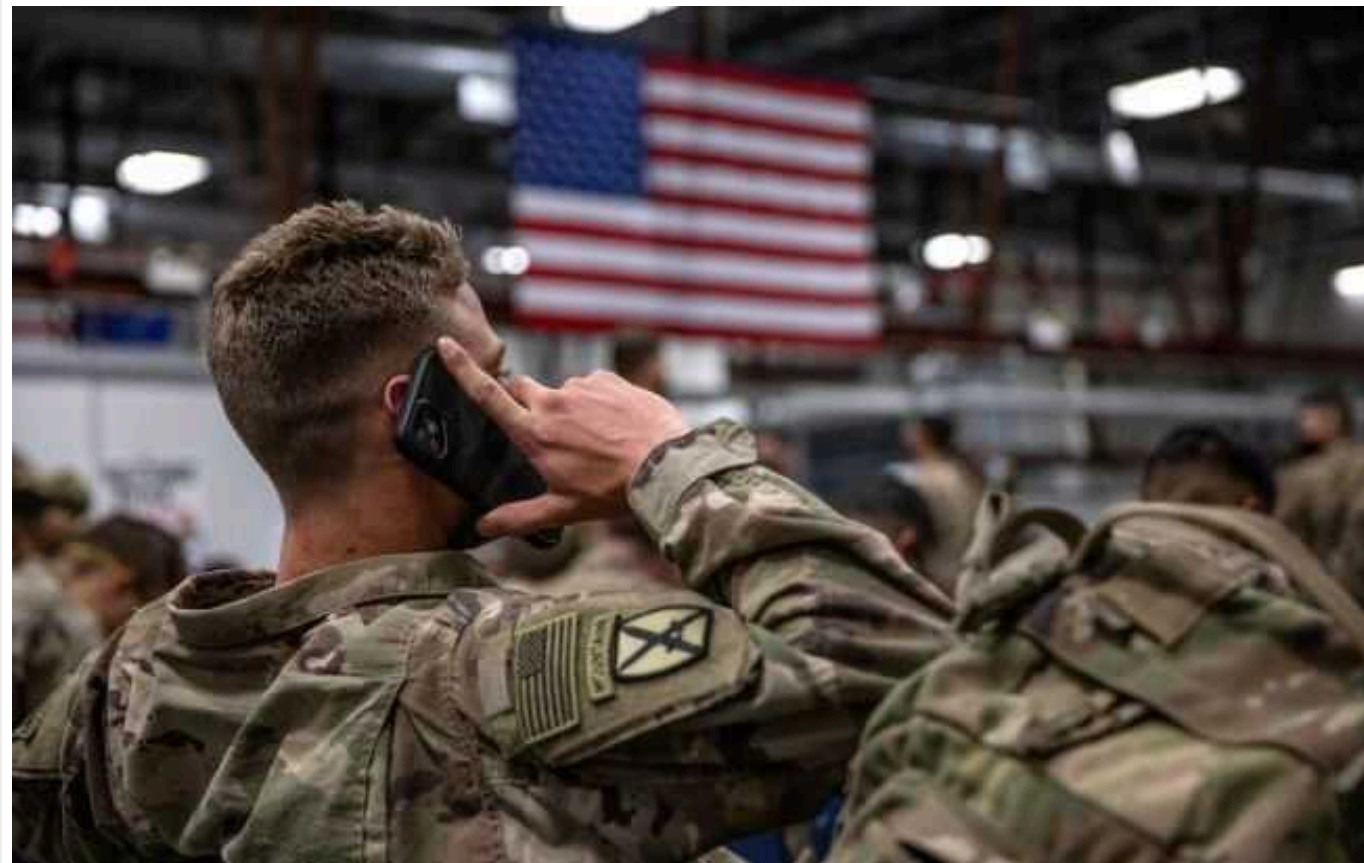
NBC: Військова операція США проти бойовиків після удару по військовій базі в Йорданії може тривати тижні

Адміністрація президента США Джо Байдена готує проведення операції у відповідь на нещодавню атаку бойовиків по американській базі в Йорданії, внаслідок чого загинули троє військовослужбовців. Така кампанія може тривати кілька тижнів.