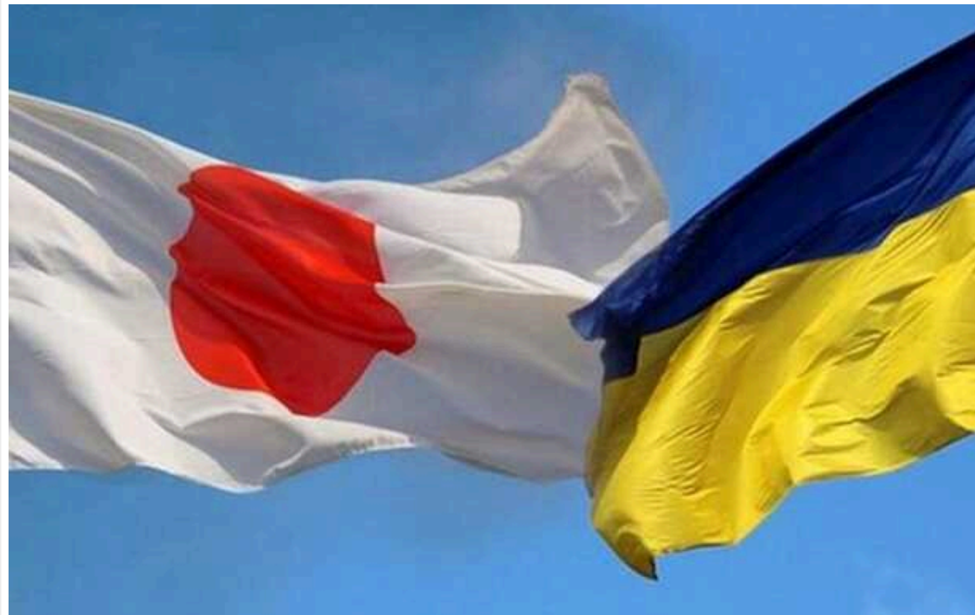
Фінансова допомога від Японії для України була єдиною допомогою від закордонних партнерів у січні

Надходження до держбюджету України 390 млн доларів від Японії стало єдиною допомогою, яку Київ зміг отримати від закордонних партнерів у січні.