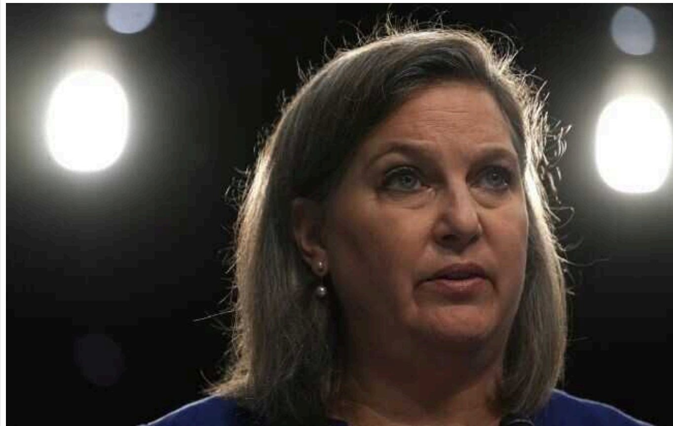
"Розуміють, що станеться, якщо Україна програє": США схвалють 60 мільярдів доларів допомоги, - Нуланд

За словами заступника держсекретаря США, навіть попри те, що Україна зміцнює оборонні редути, Володимира Путіна очікують "милі сюрпризи" на полі бою.