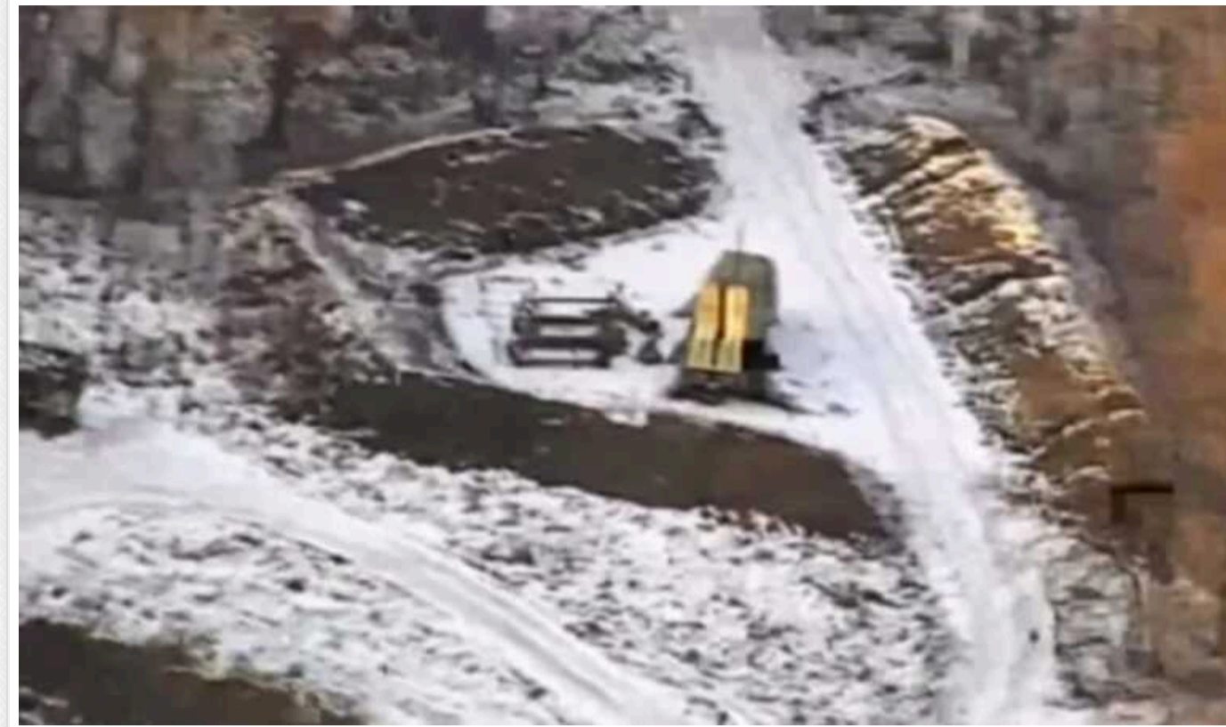
Окупанти заявили про знищення IRIS-T під Харковом: в Україні заявили, що це фальшивка

Окупанти повідомили, що їхня розвідка виявила ЗРК, а після прильоту почалася детонація. Українці ж пишуть, що ЗС РФ вдарили по порівняно недорогих "приманках" вартісною ракетною С-300, або "Іскандером".