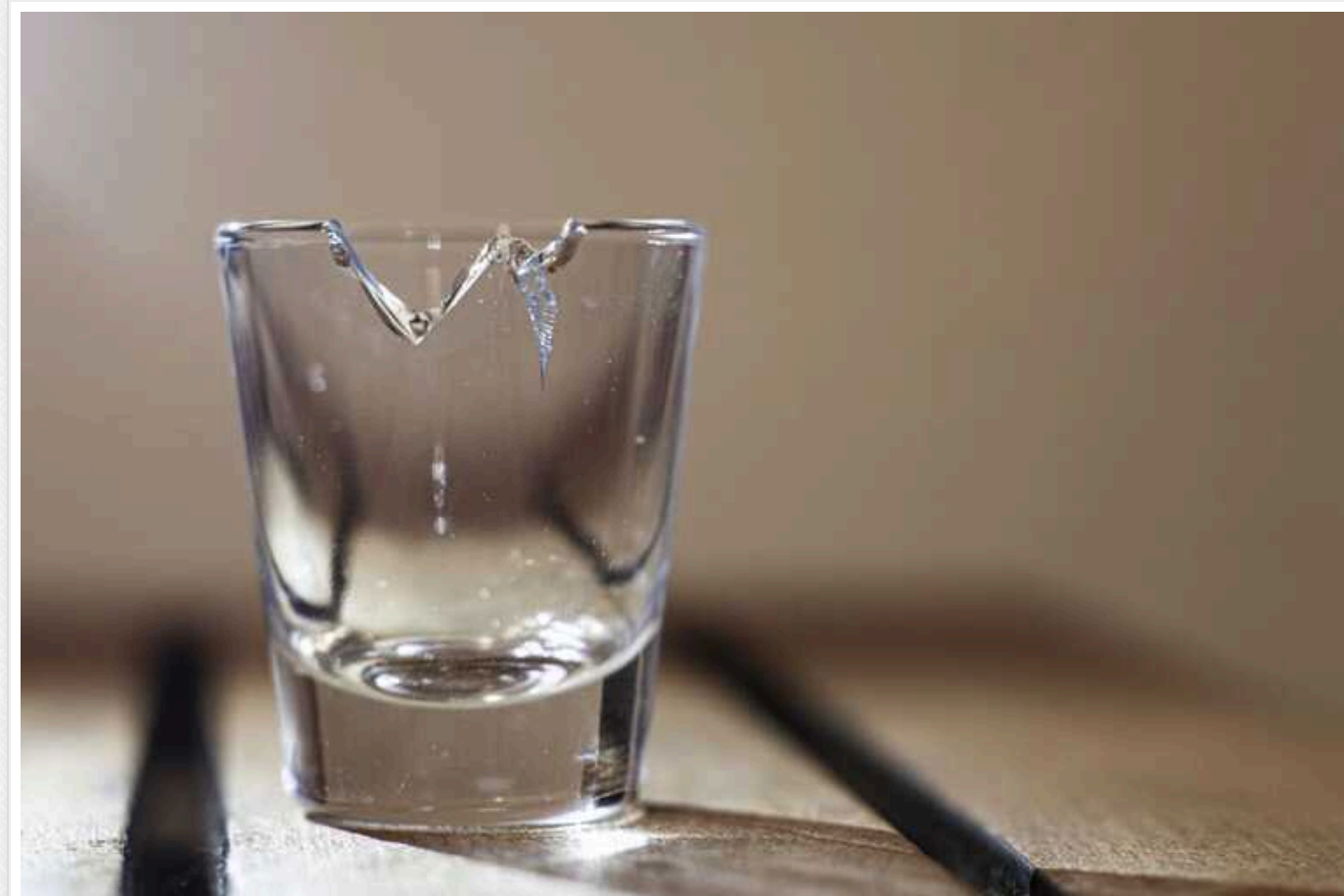
На Полтавщині жінку викликали до суду за те, що її дочка відкусила шматок склянки

Козельщинський районний суд Полтавської області 24 січня розглянув справу щодо неналежного виконання батьківських обов'язків. Перед судом постала жінка за те, що її дочка відкусила край склянки.