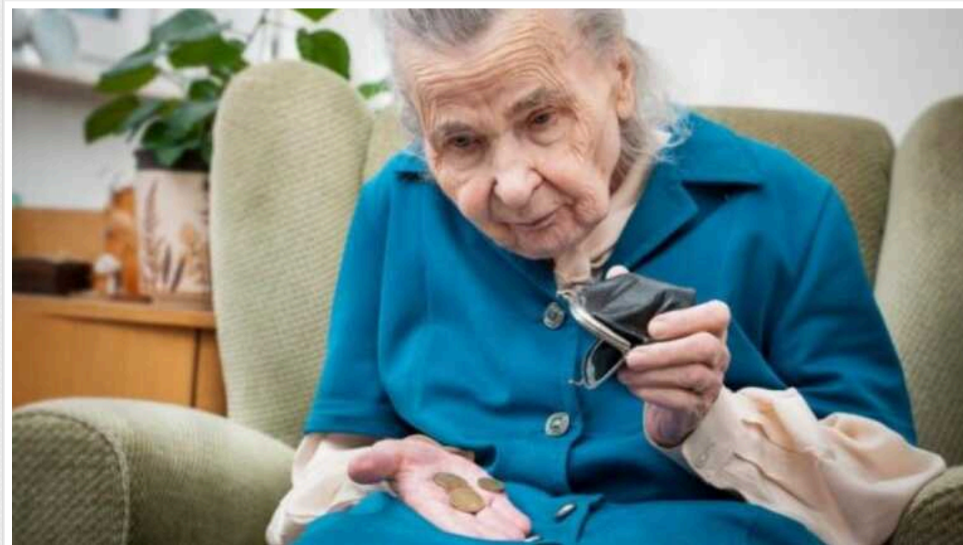
На окупованій Донеччині окупанти не справляються з виплатами пенсій і ще на рік продовжили перерахунки

Як повідомила місцева "влада" в "ДНР" ще на рік продовжили перерахунок пенсій за російським законодавством.