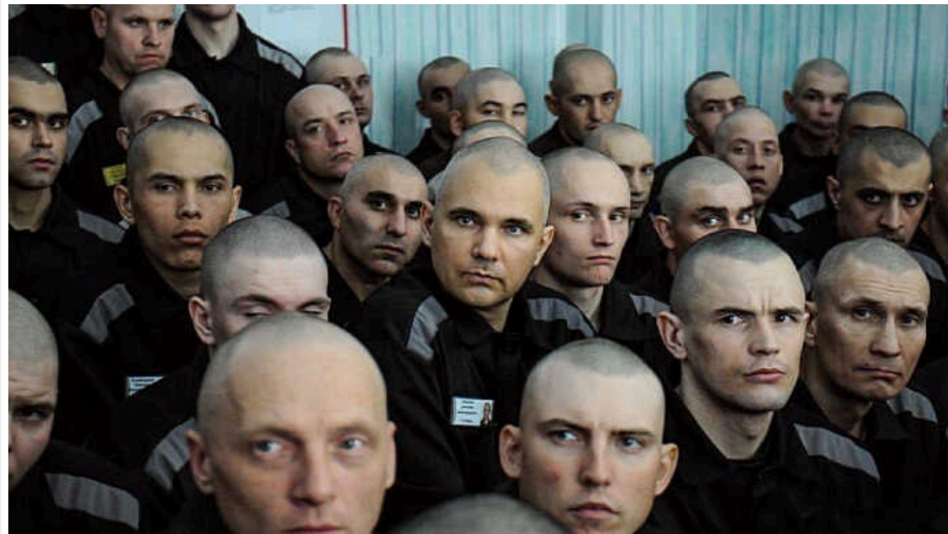
Британська розвідка пояснила, чому в Кремлі відмовилися від короткострокових контрактів із зеками

З вересня 2023 року міністерство оборони РФ припинило набір контрактників серед ув'язнених росіян за короткостроковими контрактами. Ця практика на тлі нових злочинів, скоєних звільненими злочинцями, що повернулися до Росії після 6 місяців участі у війні в Україні, викликала незадоволення у росіян.