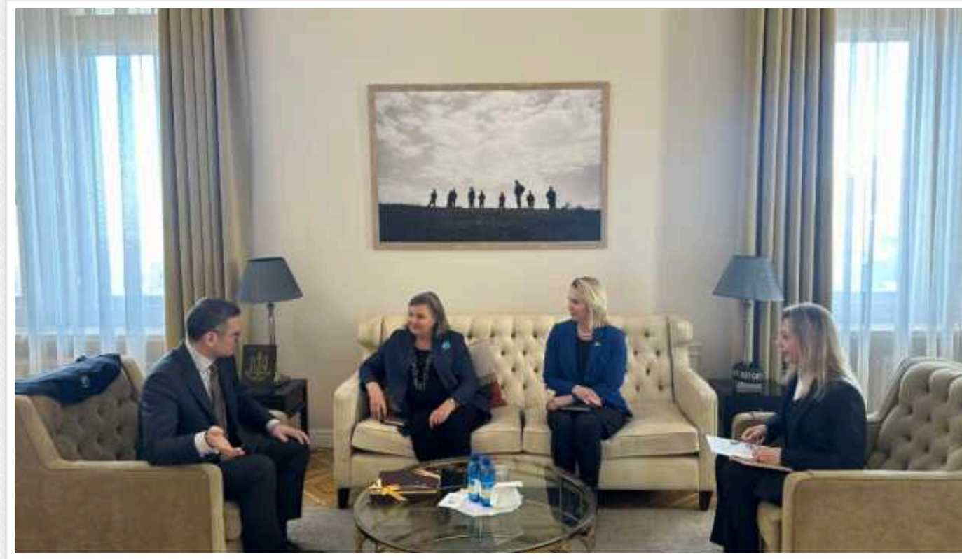
Кулеба та Нуланд обговорили продовження американської допомоги Україні

У середу, 31 січня, міністр закордонних справ Дмитро Кулеба зустрівся із заступницею держсекретаря США з політичних питань Вікторією Нуланд. Вони обговорили продовження безпекової підтримки, оборонну співпрацю, Формулу миру та підготовку до саміту НАТО у Вашингтоні.