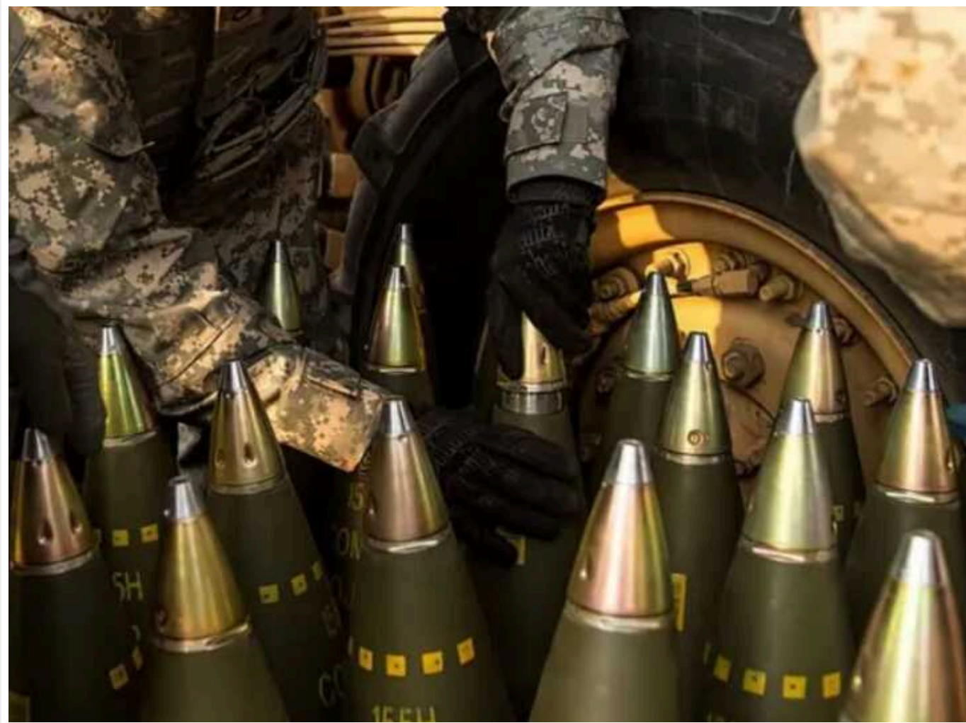
Кулеба прокоментував ситуацію з постачанням боєприпасів Україні: "Ми працюємо"

На випадок якщо Україна не зможе отримати необхідну кількість боєприпасів з одного місця, у влади є запасний план. Наразі триває робота над забезпеченням постачання з інших джерел.