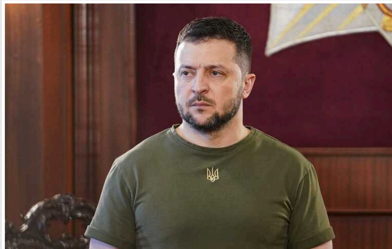
Зеленський звільнив начальника Департаменту захисту національної державності Служби безпеки України

Президент Володимир Зеленський звільнив начальника Департаменту захисту національної державності Служби безпеки України Романа Семенченка.