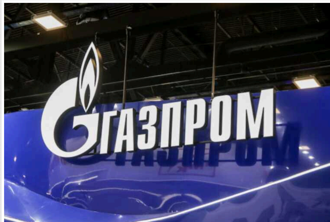
Постачання газу до Китаю компенсувало Росії лише 11% втраченого ринку Європи

Зростання експорту російського газу до Китаю за підсумками 2023 року змогло компенсувати тільки 11% обсягів, які раніше "Газпром" постачав до ЄС.