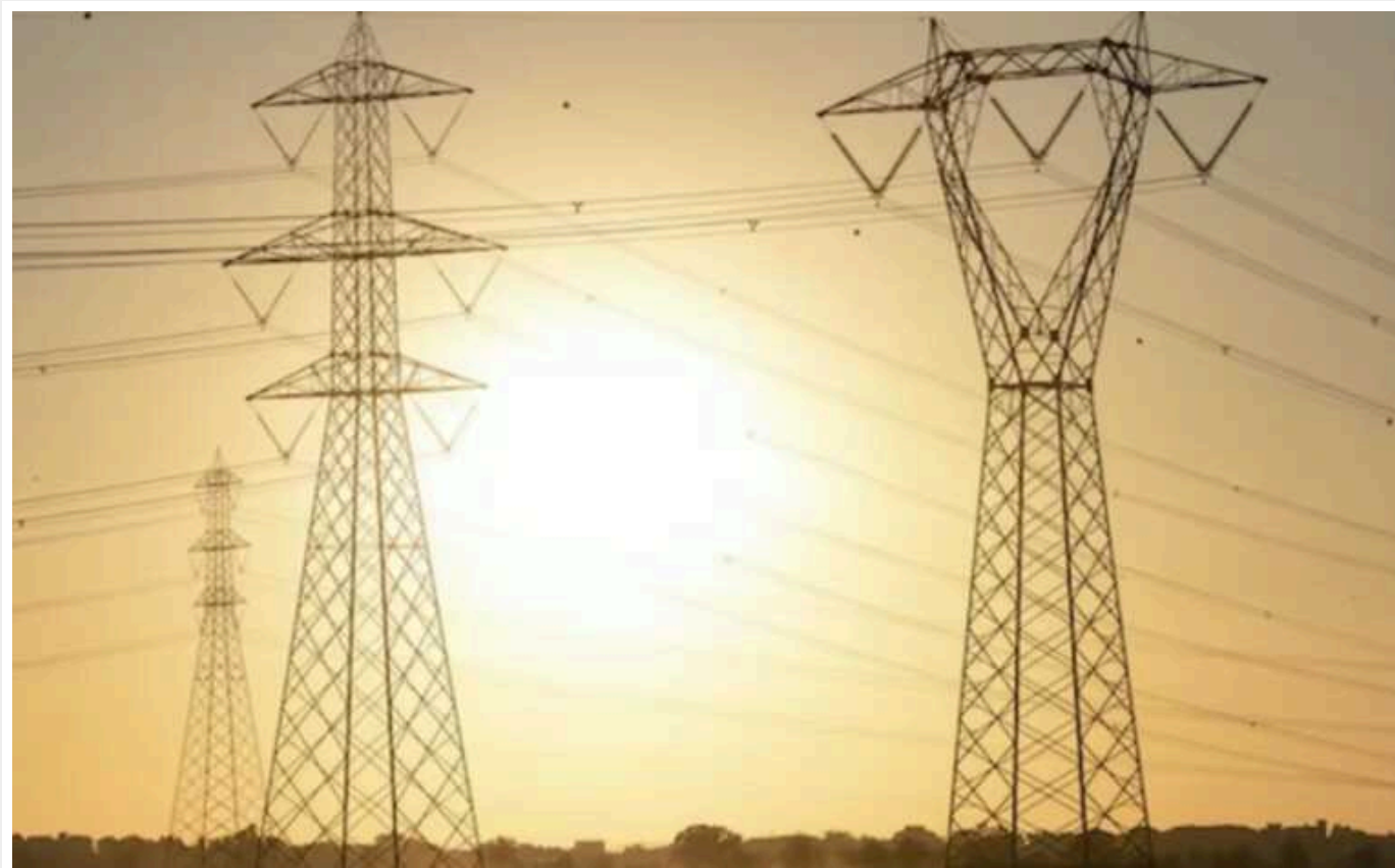
Ще треба багато пройти цією зимою, - Зеленський

Президент Володимир Зеленський у вечірньому зверненні 31 січня відзначив, що енергетична ситуація цієї зими краща, ніж у минулому році, але російські терористичні атаки ще будуть.