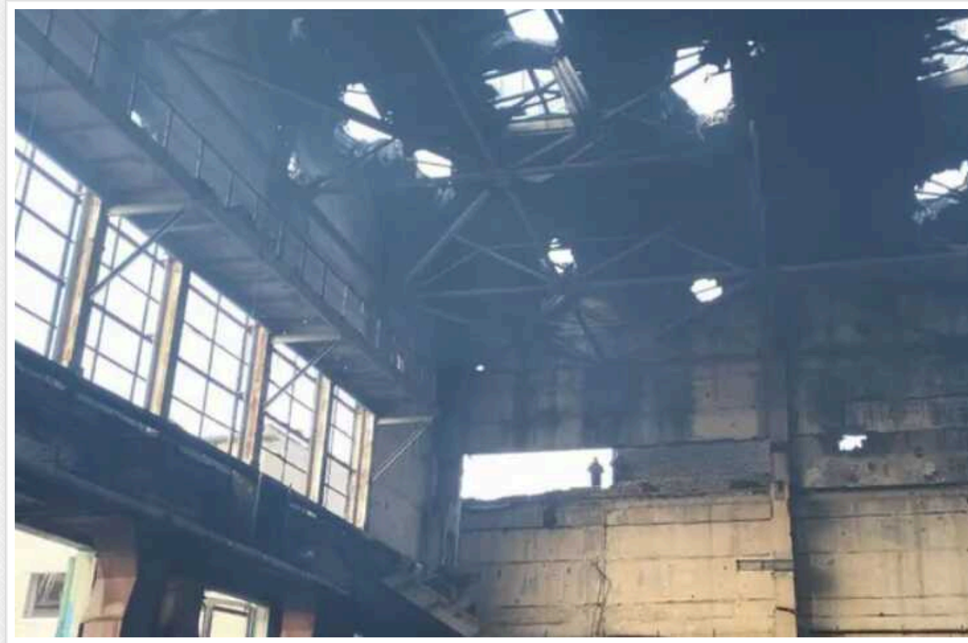
Система РЕБ безсила: в Росії показали наслідки роботи українських дронів "Баба Яга"

У Росії військовослужбовці відверто визнають, що українські дрони під назвою "Баба Яга" є "великою проблемою". Лише три таких БПЛА повністю знищили склад армії РФ на Донецькому напрямку.