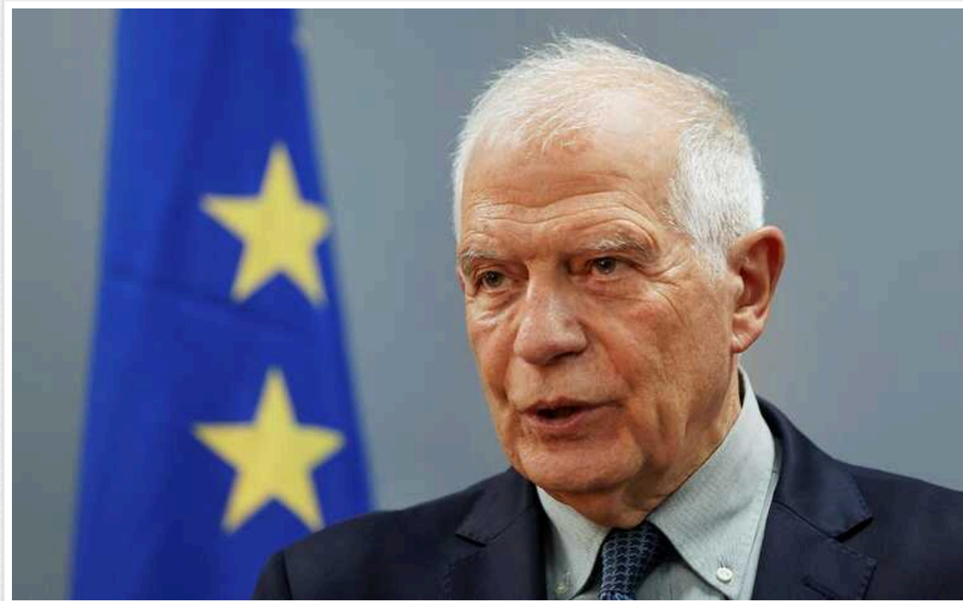
Цього року країни Євросоюзу нададуть Україні військову допомогу на 21 мільярд євро, - Боррель