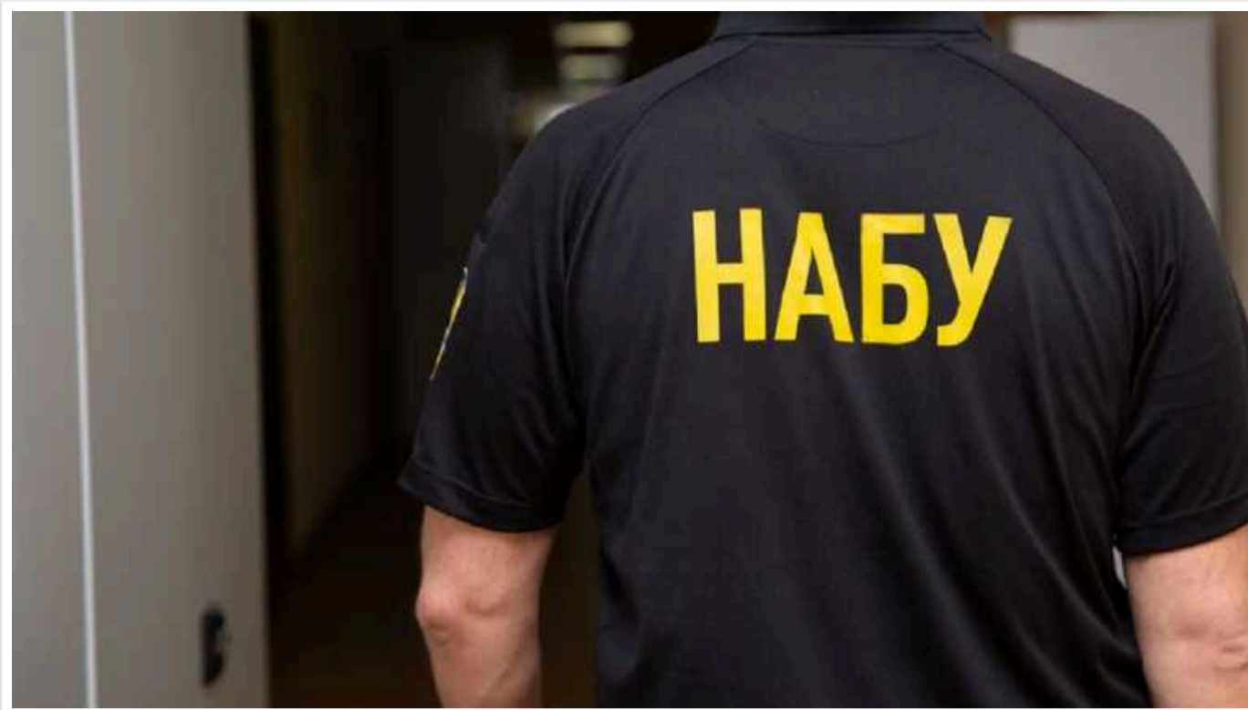
НАБУ і САП повідомили про підозру у внесенні недостовірних відомостей до е-декларації за 2020 рік чинному народному депутату України

За даними слідства, у 2020 році народний обранець задекларував криптовалюту ринковою вартістю понад 24 млн грн, яка начебто належала йому ще з 2019 року.