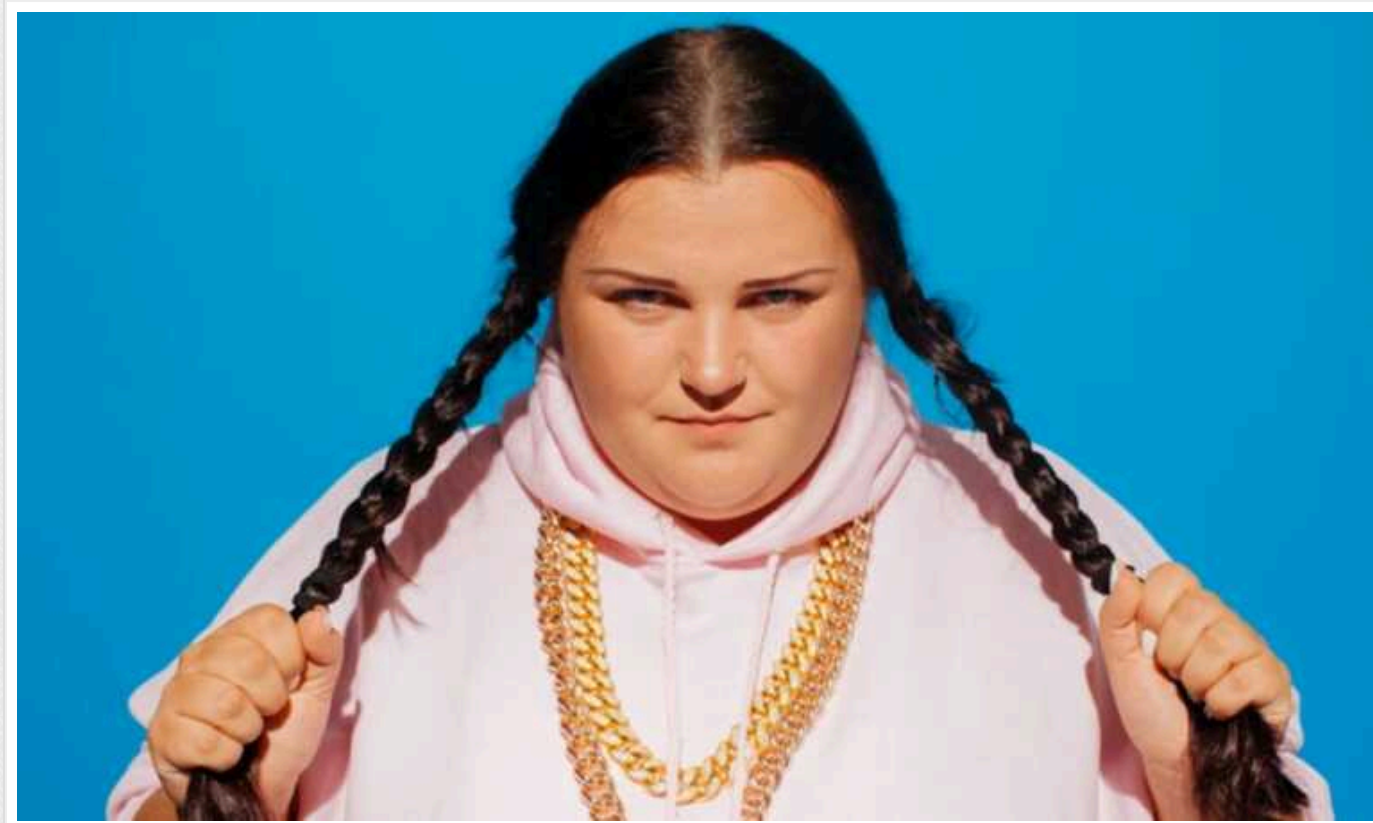
Співачка Alyona Alyona відреагувала на образи щодо її зовнішності від ведучих каналу "Ісландія"

Популярна реп-виконавиця Alyona Alyona заявила, що їй соромно, що ведучі каналу "Ісландія" пліткують та проявляють мізогінію.