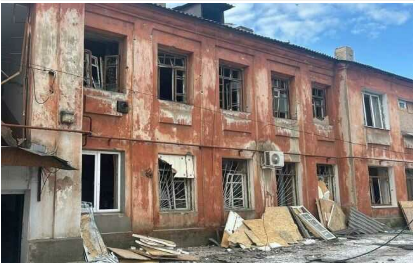
Обстріл центру Покровська: донецька поліція показала перші кадри після обстрілу

Правоохоронці опублікували відео кадрів перших хвилин після російського ракетного удару центром Покровська у Донецькій області.