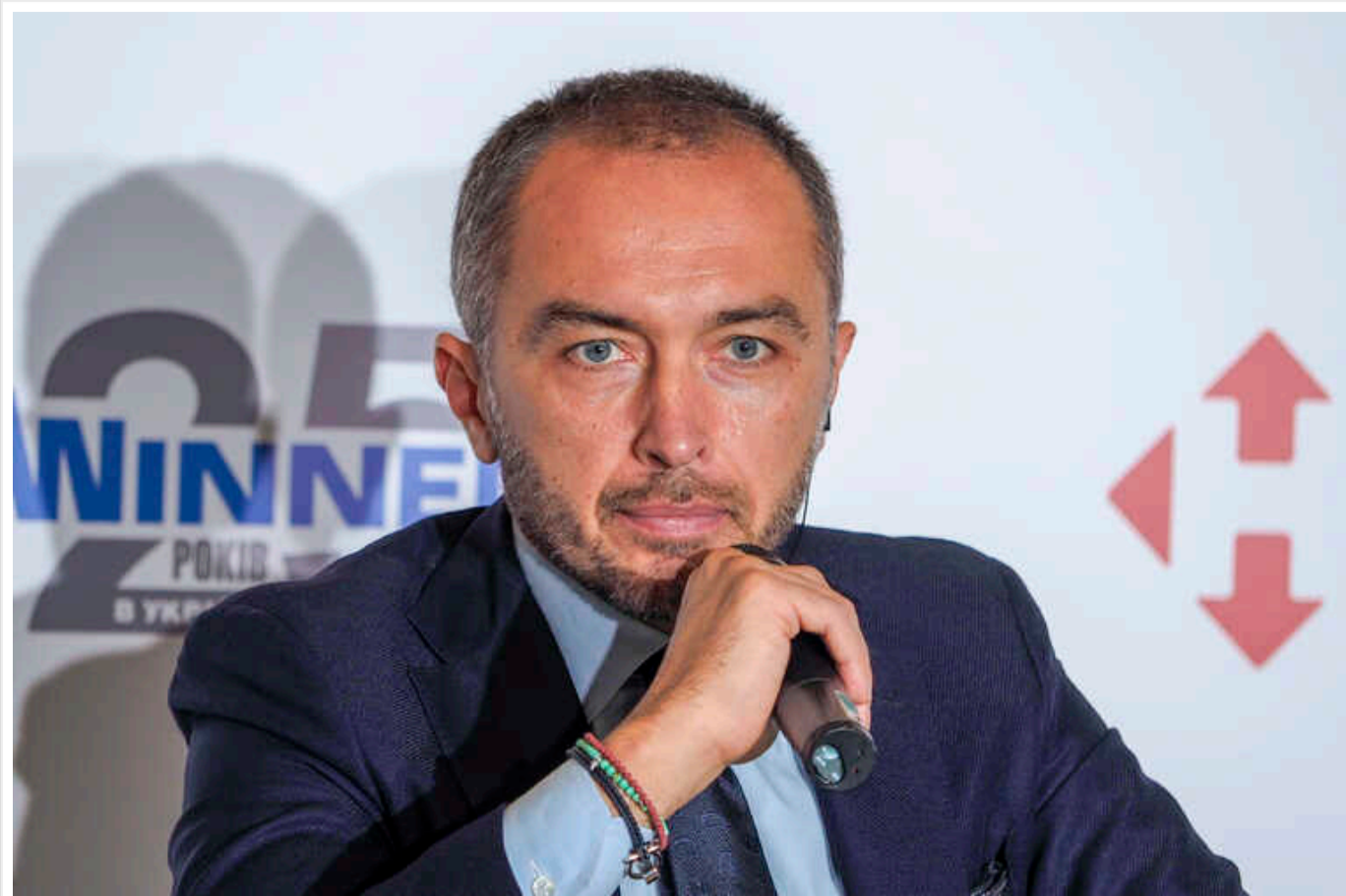
Голова Нацбанку Пишний отримує зарплату 629 тисяч на місяць, дає дружині в борг, а значну частину заощаджень тримає у валюті

Це впливає із декларації, яку опублікував Пишний.