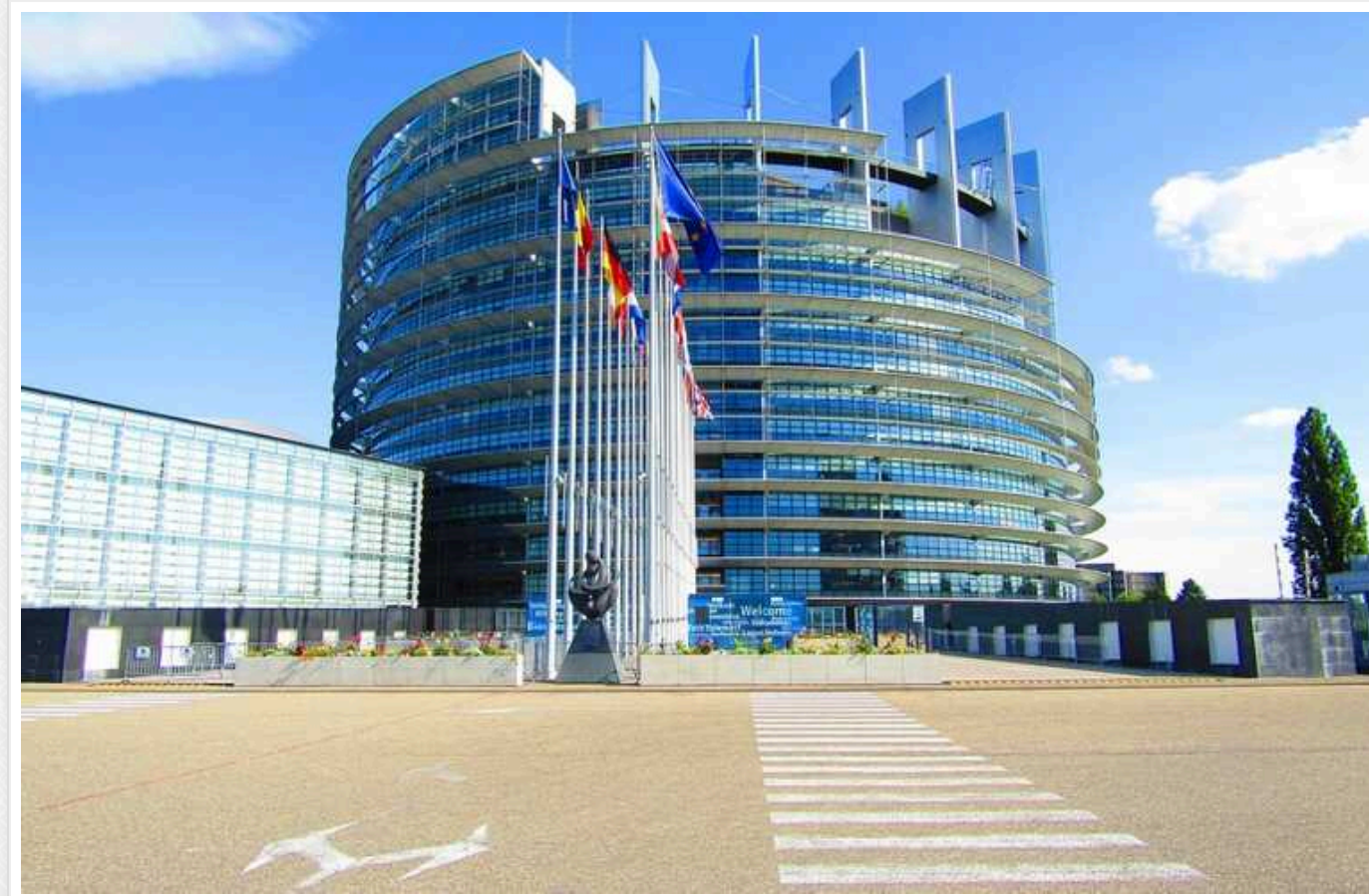
Європарламентарі у посланні до прем'єра Угорщини закликали підтримати допомогу Україні

Президенти більшості груп у Європарламенті у чіткому посланні до угорського прем'єра Віктора Орбана наголосили на потребі ухвалити рішення про допомогу Україні без зволікань.