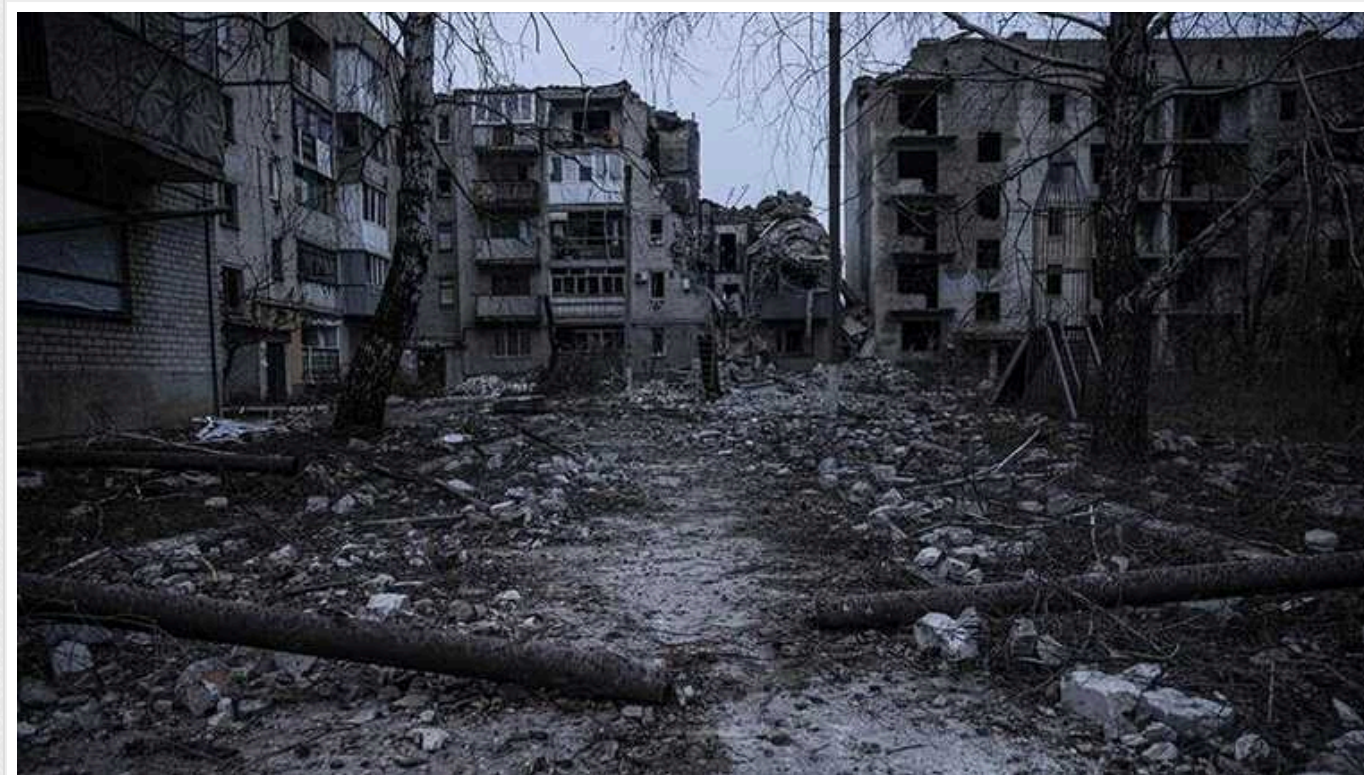
Український військовий розповів про стабілізацію ситуації на Бахмутському напрямку