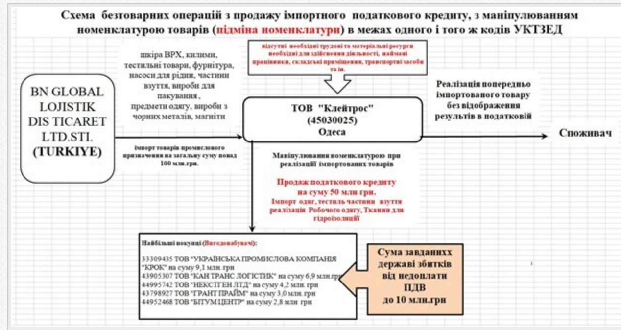
Схема виведення валюти за кордон з уникненням оподаткування компанією ТОВ «Клейтрос».

Маніпулювання номенклатурою при реалізації імпортованих товарів. Продаж податкового кредиту на суму 50 млн грн. Сума завданих державі збитків від недоплати ПДВ до 10 млн.грн