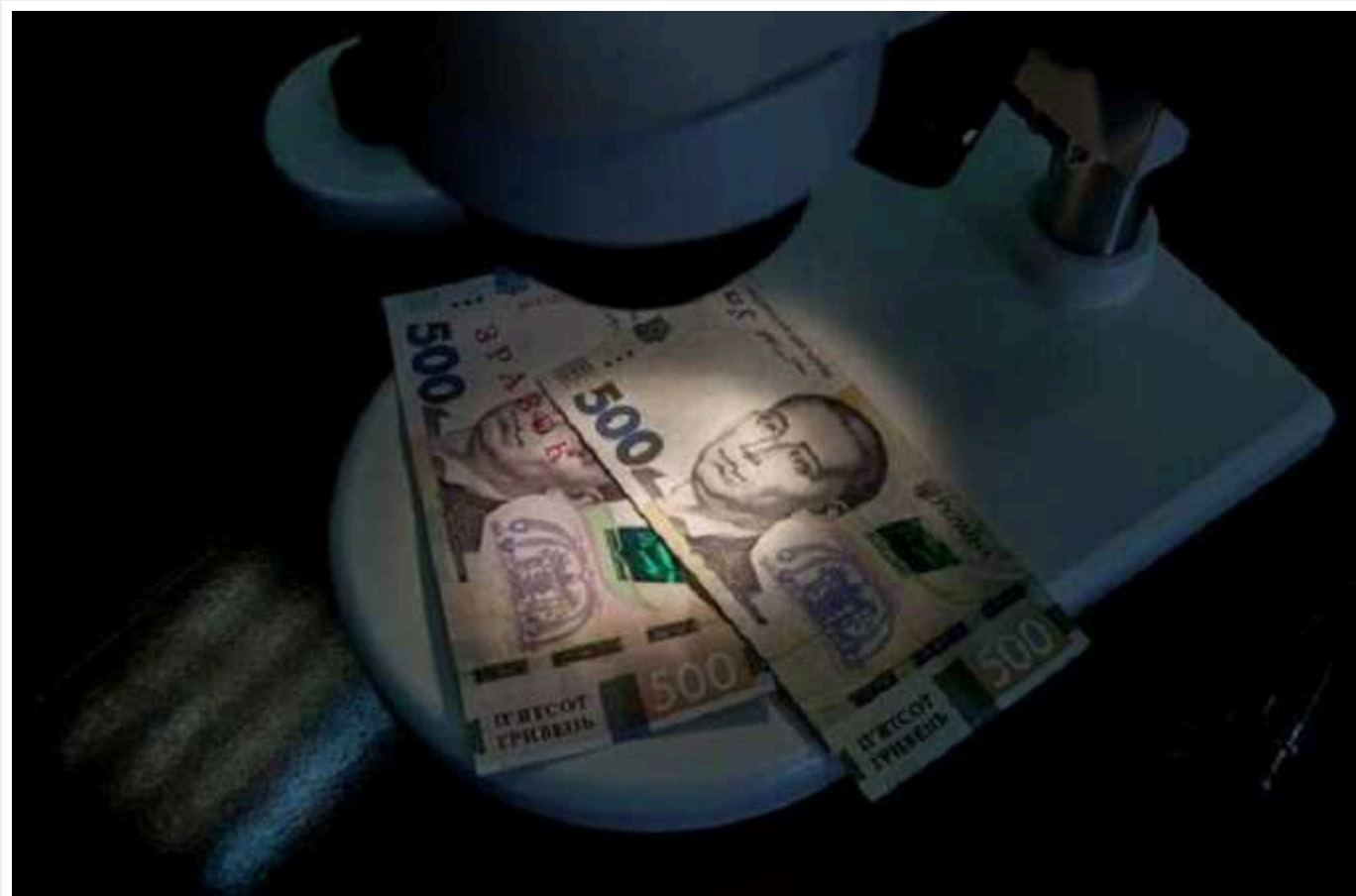
Викрито компанію на несплаті 10 мільйонів гривень ПДВ

Викрито чергову схему безтоварних операцій з продажу імпортованого податкового кредиту, з маніпулюванням номенклатурою товарів (підміна номенклатури) у межах одного і того ж кодів УКТЗЕД.