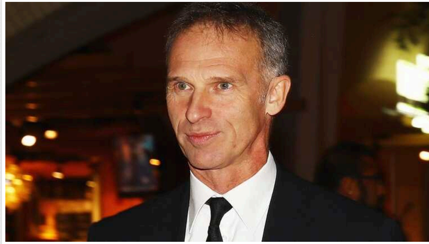
Легенда світового спорту Домінік Гашек виступив проти Росії, яка "рекламує війну, злочини та геноцид"

Легендарний хокейний воротар Домінік Гашек виступив із різкою позицією щодо участі Росії в іноземних спортивних турнірах. Олімпійський чемпіон Нагано-98 закликає усі цивілізовані країни припинити підтримувати РФ на міжнародній арені.