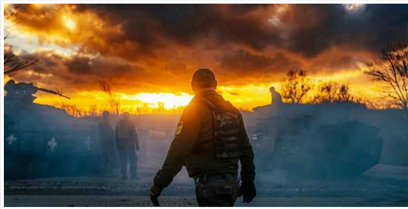
Лідери Німеччини, Данії, Чехії, Естонії та Нідерландів закликають посилити військові постачання Україні, - Financial Times

Лист лідерів Німеччини, Данії, Чехії, Естонії та Нідерландів із закликом посилити військові постачання Україні публікує Financial Times.