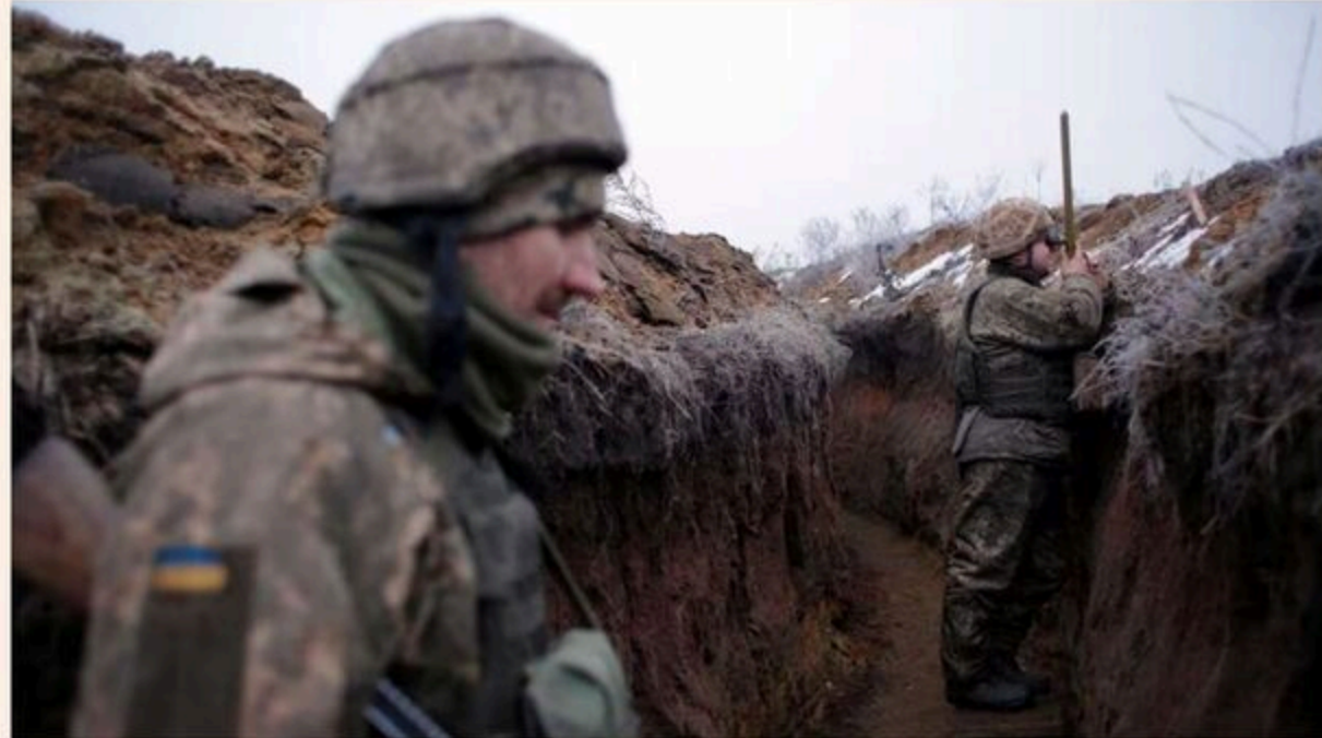
Ukraine's military is in urgent need of arms and ammunition, with support from EU member states more important than ever

From Olaf Scholz, Chancellor of Germany; Mette Frederiksen, Prime Minister of Denmark; Petr Fiala, Prime Minister of the Czech Republic; Kaja Kallas, Prime Minister of Estonia; and Mark Rutte, Prime Minister of the Netherlands