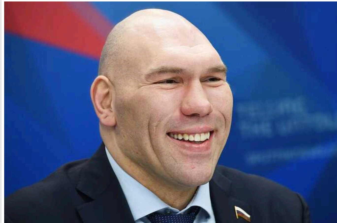
Валуєв обурився дискваліфікацією Валієвої: "З Росії роблять опудало, яке нападе на Європу"

Колишній чемпіон світу у надважкій вазі Микола Валуєв обурився дискваліфікацією фігуристки Каміли Валієвої за вживання допінгу. Депутат Державної думи звинуватив західні країни у дискредитації РФ і тому, що "з Росії роблять опудало, яке скоро нападе на Європу", забувши про постійні погрози саме з боку своєї країни.