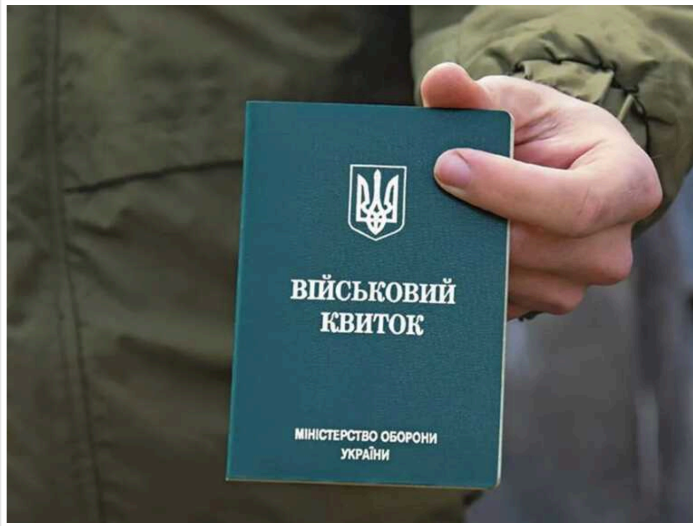
Законопроект про мобілізацію: на користь ЗСУ зможуть вилучати транспорт

На потреби Збройних сил України можуть забрати автомобільний транспорт.