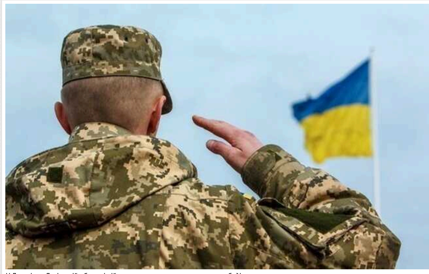
У Львові та Львівській області військкоми почали використовувати бодікамери

Тепер військовослужбовці Збройних Сил України, перед якими стоїть завдання Генерального штабу, щодо мобілізації населення Львівської області під час щоденних патрулювань та здійснення заходів оповіщення громадян, будуть використовувати бодікамери.