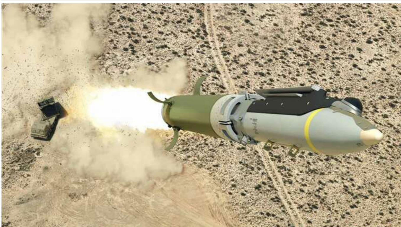
У Пентагоні підтвердили передачу Україні бомб GLSDB

Міністерство оборони США підтвердило наміри передати Україні бомби малого діаметра наземного запуску (GLSDB). Однак відомство відмовилося назвати терміни передачі Києву цих озброєнь.