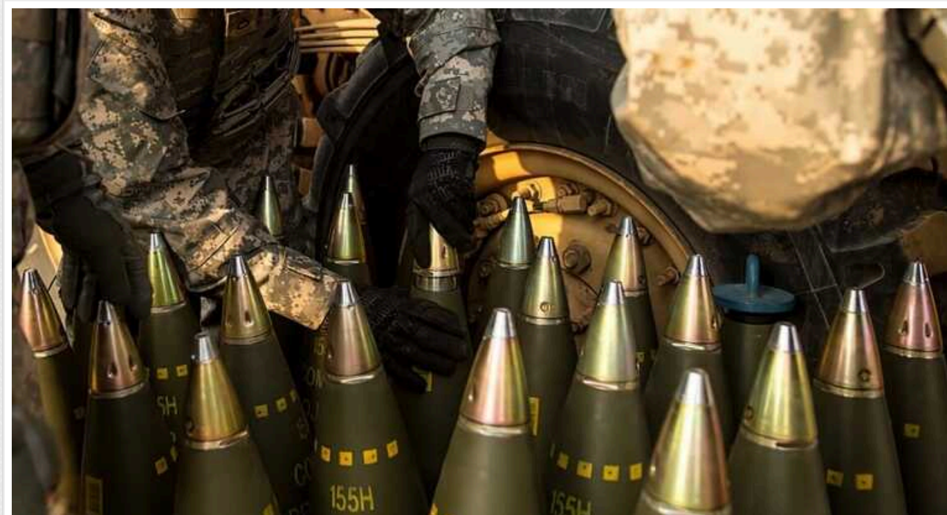
Bloomberg: Євросоюз може надати Україні до березня лише 600 тисяч, а не мільйон снарядів

Європейський союз не зможе надати обіцяний мільйон снарядів Україні до терміну, що був обумовлений раніше, 1 березня 2024 року.