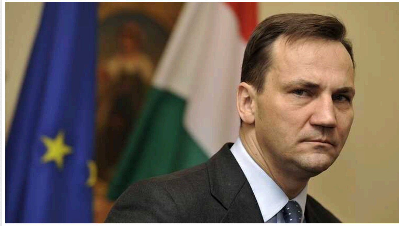
Путін погрожує абсолютно серйозно. "Іскандери" можуть долетіти до Берліна, – глава МЗС Польщі

Російський диктатор Володимир Путін погрожує країнам Європи абсолютно серйозно. Ракети "Іскандер" можуть долетіти аж до Берліна. Тому західні союзники повинні послити допомогу Україні.