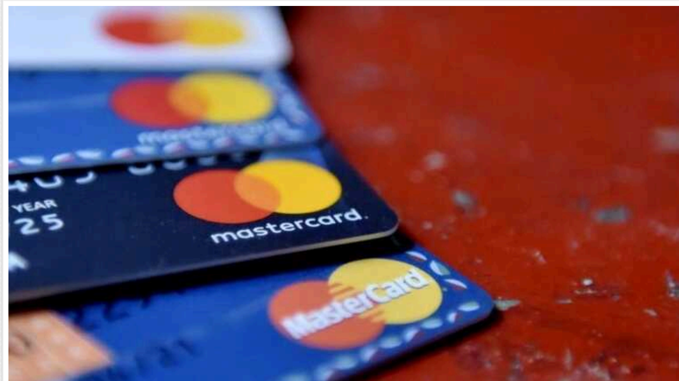
В Україні банки блокують перекази: через які операції виникнуть проблеми

В Україні через перекази можуть заблокувати картку та вимагати документи, які мають пояснити такі фінансові дії. Під особливу підозру підпадають великі онлайн-покупки, зняття великих сум, операції з криптовалютою, великі перекази.